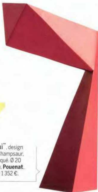
“Origami”, design François Champsaur, en acier laqué. Ø 20 x H. 36 cm, Pouenat , à partir de 1 352 €.