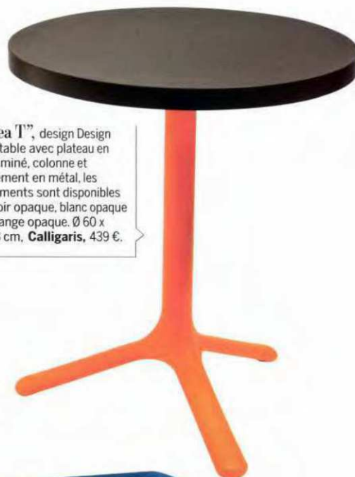
"Area T" , design Design Lab, table avec plateau en mélaminé, colonne et piétement en métal, les 2 éléments sont disponibles en noir opaque, blanc opaque et orange opaque. Ø 60 x H. 73 cm, Calligaris , 439 €.