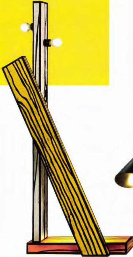
“Chopped stock lamp”, design Richard Woods pour Post Design Collection Crossing, en bois massif peint et décoré main, édition limitée 25 pièces. L. 47 x P. 18 x H. 110 cm, Memphis Milano , 4 215 €.