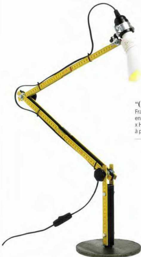
“Tools”, design Fabien Dumas, bras articulé en mètre de chantier soutenu par une base en métal, abat-jour en métal. L. env 100 cm, DH PH à la Gallery S. Bensimon , 450 €.