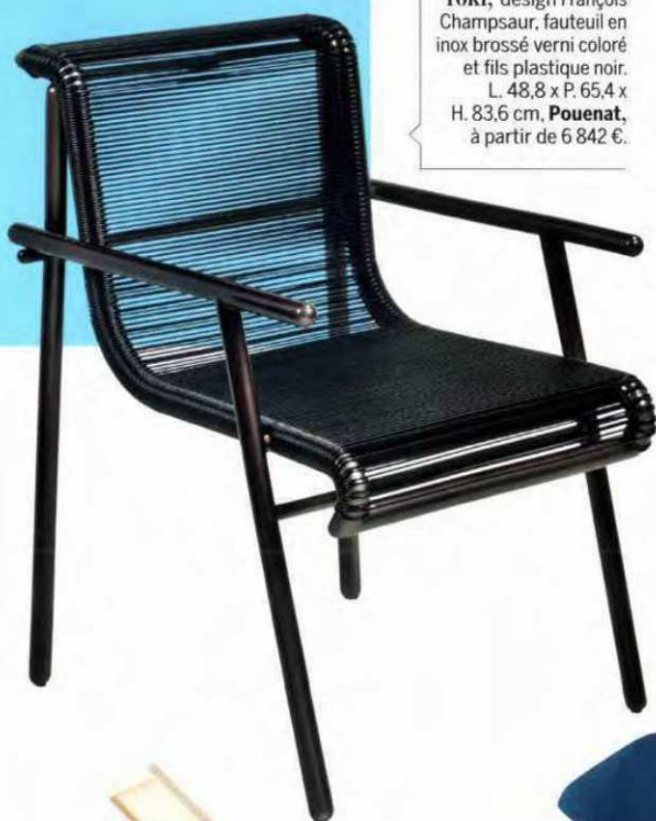
Toki , design François Champsaur, fauteuil en inox brossé verni coloré et fils plastique noir. L. 48,8 x P. 65,4 x H. 83,6 cm, Pouenat , à partir de 6 842 €.