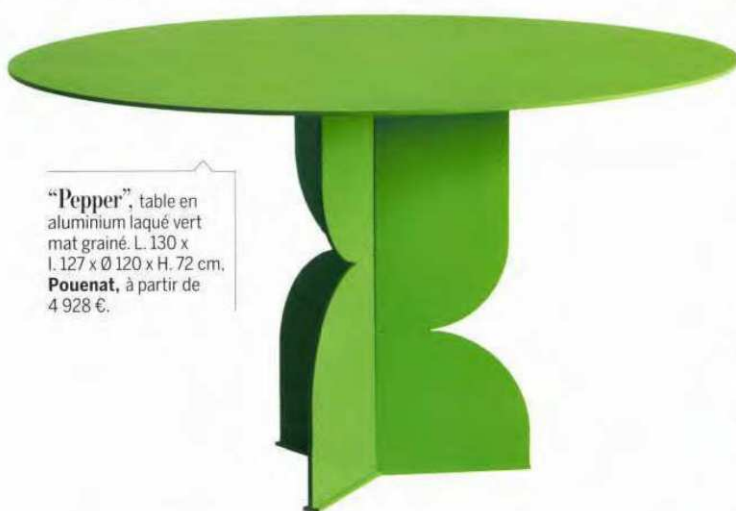
“Pepper”, table en aluminium laqué vert mat grainé. L. 130 x l. 127 x Ø 120 x H. 72 cm, Pouenat , à partir de 4 928 €.