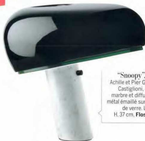
“Snoopy”, design Achille et Pier Giacomo Castiglioni, base en marbre et diffuseur en métal émaillé sur plaque de verre. L. 39,5 x H. 37 cm, Flos , 774 €.