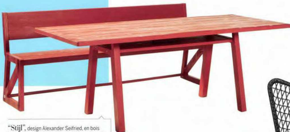
“Stijl”, design Alexander Seifried, en bois laqué, banc. L. 145 x l. 49 x H. 81,5 cm, à partir de 970 € et table L. 160 x l. 90 x H. 75 cm, existe d'autres dimensions, Richard Lampert , à partir de 1 350 €.