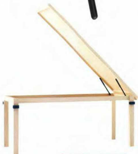
"Butler" , structure en chêne et auvent en coton qui se range dans le coffre de la table. L. 241 x l. 141,4 x H. 218,4 cm, Habitat , 1 499 €.