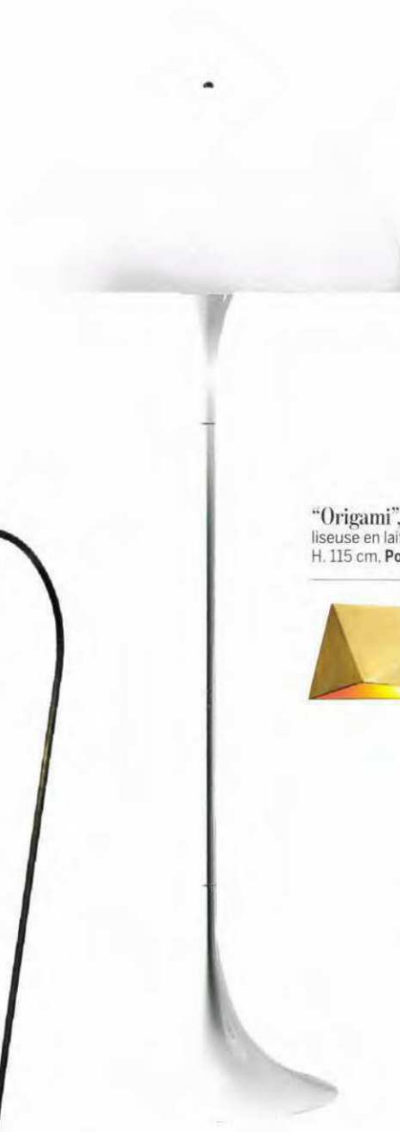
“Origami”, design François Champsaur, liseuse en laiton brossé verni mat. Base Ø 25 x H. 115 cm, Pouenat , à partir de 3 558 €.