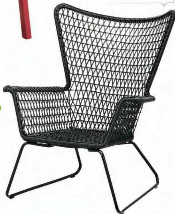
“Högsten”, fauteuil avec assise en plastique polyéthylène tressé, pieds en acier. L. 74 x P. 78 x H. 93 cm, Ikea , 99 €.