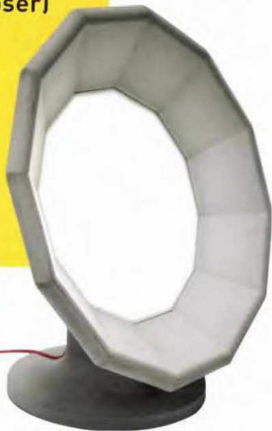
“Point de Suspension”, design Matali Crasset, en béton fibré très haute performance. L. 53 x P. 50 x H. 31,5 cm, Concrète by LCDA , à partir de 1 450 €.