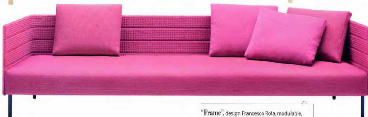
"Frame" , design Francesco Rota, modulable, structure en aluminium revêtue de tissu Rope, matelas et coussins du dossier déhoussables en mousse polyester hydrofuge, finition tissu Rope T ou éponge Luz. À partir de L. 206 x P. 110 cm, Paola Lenti , à partir de 9 735 €.