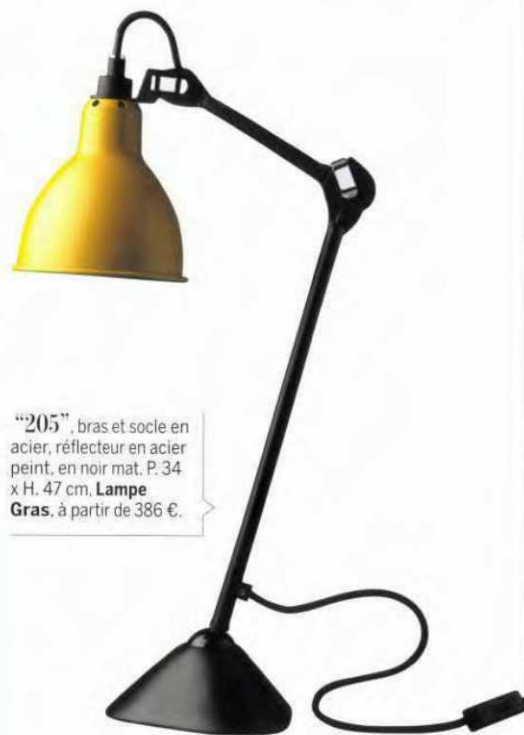
“205”, bras et socle en acier, réflecteur en acier peint, en noir mat. P. 34 x H. 47 cm, Lampe Gras , à partir de 386 €.