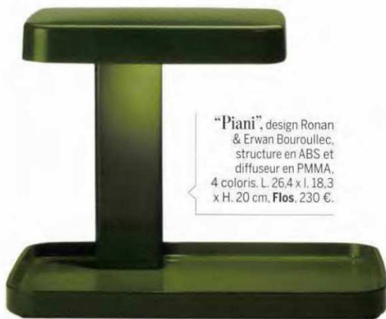
“Piani”, design Ronan & Erwan Bouroullec, structure en ABS et diffuseur en PMMA, 4 coloris. L. 26,4 x l. 18,3 x H. 20 cm, Flos , 230 €.