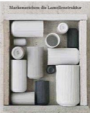
Markenzeichen: die Lamellenstruktur

Sie brachten sanft Bewegung ins Porzellan und wurden dafür geliebt. Bis 1969, dann verschwanden die filigranen Produkte der Manufaktur Danmark vom Markt. Das dänische In-Label Karakter entdeckte sie wieder und beschert den hübschen Lamellen unter dem neuen Namen "Lyngby Porzellan" ein fantastisches Comeback!