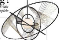
Leuchte "Helios" von Jean-Louis Deniot, P. a. A.

Wie eine Traditionsfirma zum Lifestyle-Label wird? Mit neuem, spannendem Design-Partner! Hier zwei gute Beispiele