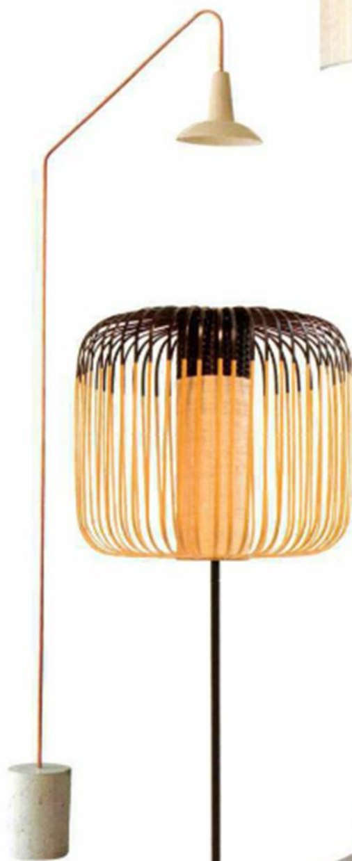
▲ "OVALUM", design Olivier Vallaëys, en béton, cuivre et porcelaine, entre L. 170 et L. 180 cm, Portobello , 645 €.