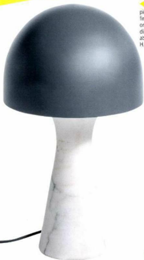
◀ "TOPSY", piétement en marbre, finition mate, abat-jour orientable en métal gris, diam. 11,2 x H. 50 cm, abat-jour diam. 30 x H. 28 cm. AM.PM. , 249 €.