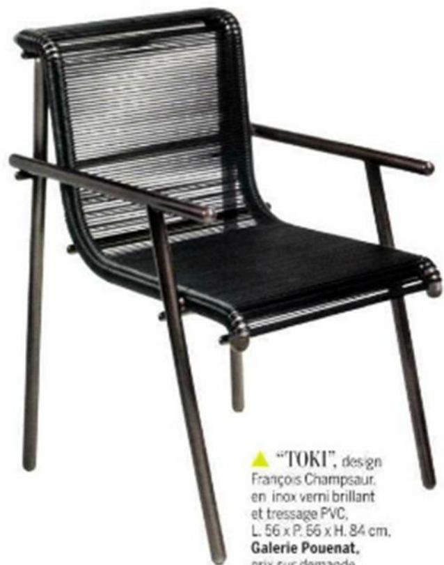
▲ "TOKI", design François Champsaur, en inox verni brillant et tressage PVC, L. 56 x P. 66 x H. 84 cm, Galerie Poudenat , prix sur demande.