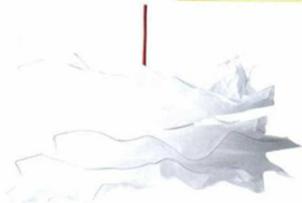
▲ "KRUSNING" , design Sigga Heimis, en papier blanc, diam. 43 x H. 43 cm. Ikea , 7,99 €.