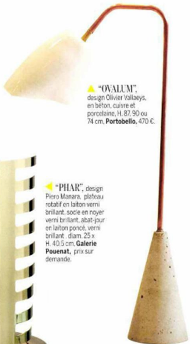
▲ "OVALUM", design Olivier Vallaeys, en béton, cuivre et porcelaine, H. 87, 90 ou 74 cm. Portobello , 470 €.