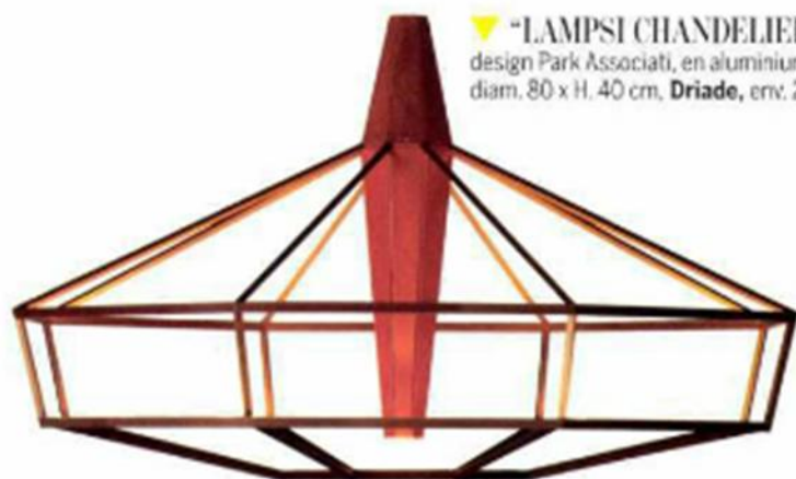
▼ "LAMPISI CHANDELIER" , design Park Associati, en aluminium, diam. 80 x H. 40 cm. Driade , env. 2 837 €.