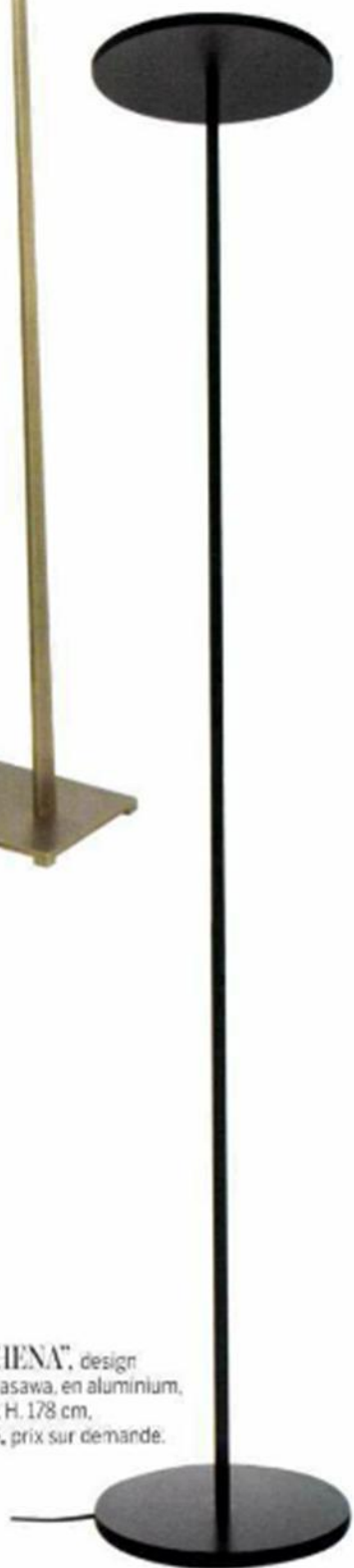
▶ "ATHENA", design Naoto Fukasawa, en aluminium, diam. 32 x H. 178 cm, Artemide , prix sur demande.