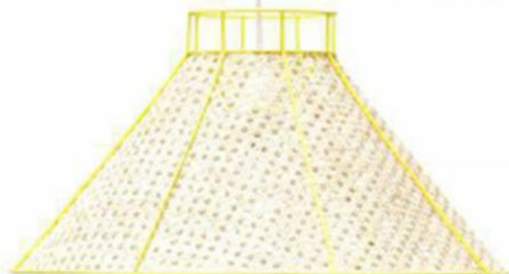
▼ "STRAW" , design Isabelle Gilles et Yann Poncelet, en métal laqué et cannage, 3 coloris : jaune, diam. 49,5 x H. 25 cm, corail, diam. 36 x H. 28 cm, noir, diam. 37,5 x H. 37 cm. Colonel , 230 €.