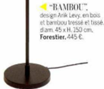
◀ "BAMBOU", design Arik Levy, en bois et bambou tressé et tissé, diam. 45 x H. 150 cm, Forestier , 445 €.