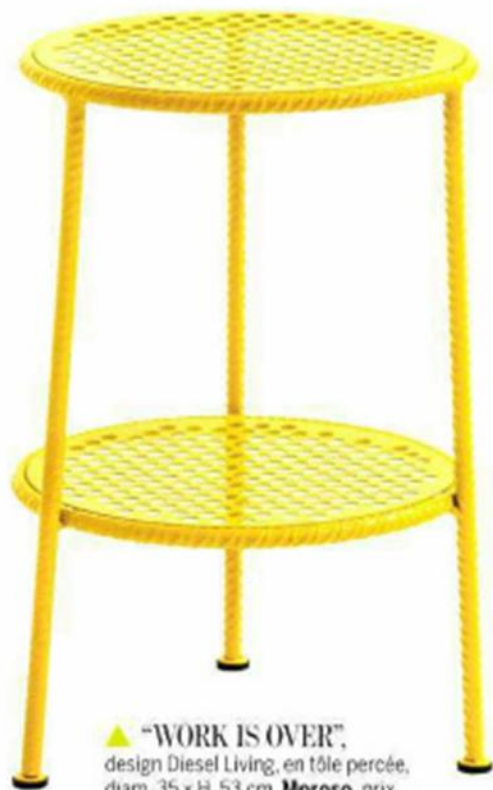
▲ "WORK IS OVER", design Diesel Living, en tôle percée, diam. 35 x H. 53 cm, Moroso , prix sur demande.