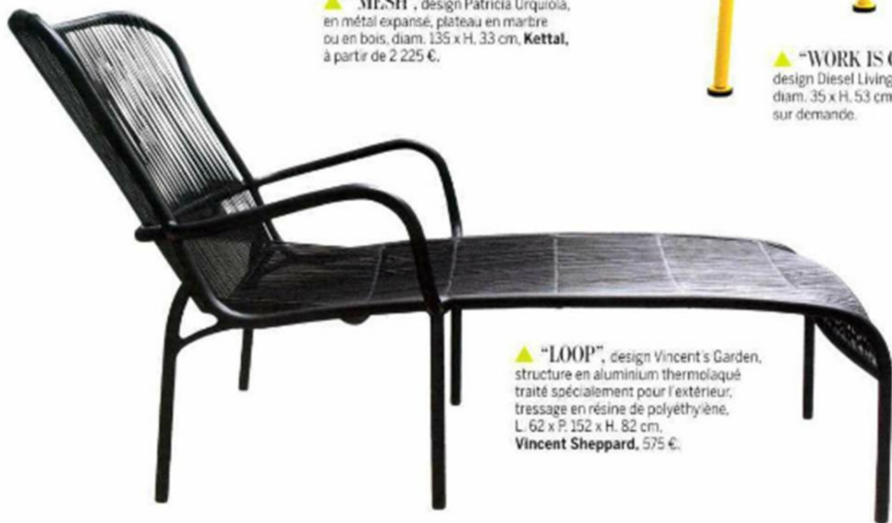
▲ "LOOP", design Vincent's Garden, structure en aluminium thermolaqué traité spécialement pour l'extérieur, tressage en résine de polyéthylène, L. 62 x P. 152 x H. 82 cm, Vincent Sheppard , 575 €.