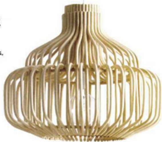
▲ "ENDLESS" , design Atelier N/7, fabriqué à la main en rotin, diam. 49 x H. 61 cm. Vincent Sheppard , 319 €.