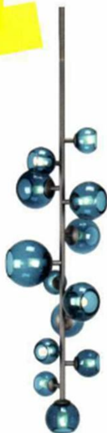
▲ "LAST NIGHT TOTEM" , design Damien Langlois-Meurinne, structure en laiton bronze antique foncé, boules en verre soufflé teinté turquoise. H. 115/230 cm. Galerie Pouenat , prix sur demande.