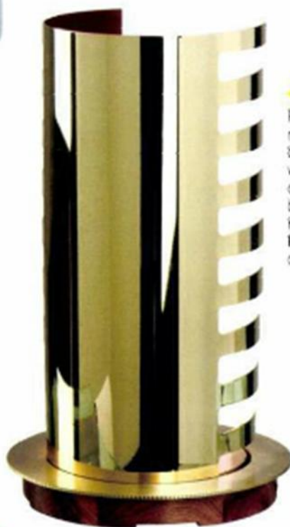
◀ "PHAR", design Piero Manara, plateau rotatif en laiton verni brillant, socle en noyer verni brillant, abat-jour en laiton poncé, verni brillant, diam. 25 x H. 40,5 cm. Galerie Pouenat , prix sur demande.