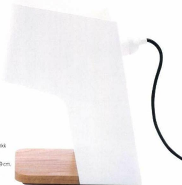
▶ "FOLDO", design Decha Archjananun, Thinkk Studio, en acier et chêne massif, L. 25 x P. 16 x H. 29 cm. éditions Thingg chez Specimen Editions , 249 €.