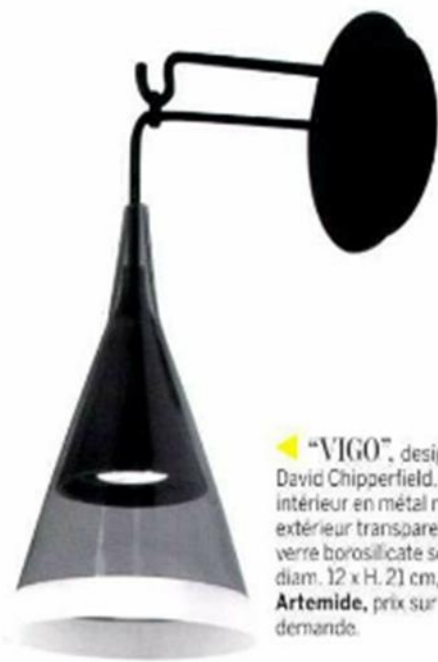
▶ "VIGO", design David Chipperfield, cône intérieur en métal noir, extérieur transparent en verre borosilicate soufflé, diam. 12 x H. 21 cm. Artemide, prix sur demande.