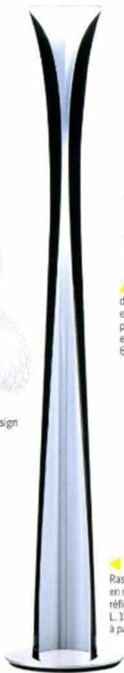
◀ "CADMO", design Karim Rashid, corps de lampe en matériau thermoplastique, réflecteur en aluminium, L. 13 x H. 54 cm, Artemide , à partir de 1 488 €.