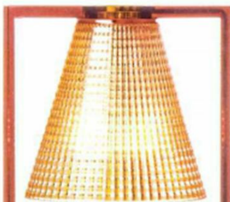
▲ "LIGHT AIR SCULPTÉE", design Eugeni Quirlet, en technopolymère thermoplastique transparent ou teinté dans la masse, P. 17 x H. 32 cm. Kartell , 144 €.