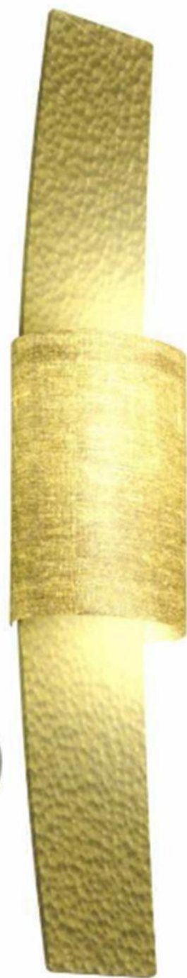
▲ "SKI", design Piero Manara, en laiton martelé, patine bronze clair, verni satiné, abat-jour en tissu. L. 15 x H. 68 cm. Pouenat, prix sur demande.