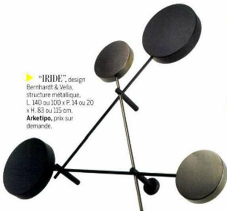
▶ "IRIDE", design Bernhardt & Vella, structure métallique, L. 140 ou 100 x P. 14 ou 20 x H. 83 ou 115 cm. Arketipo, prix sur demande.