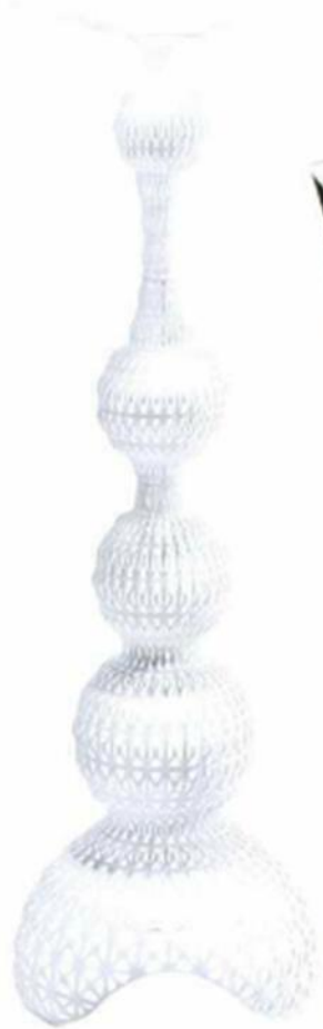
▲ "KABUKI", design Ferruccio Laviani, en plastique, diam. 50 x H. 170 cm, Kartell , prix sur demande.