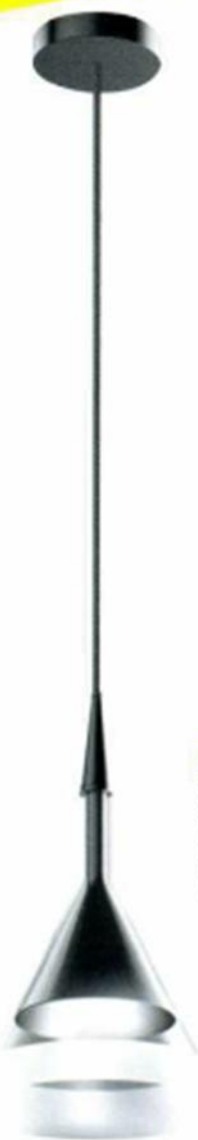
▲ "CONICA" , design David Chipperfield, en aluminium et verre borosilicate, diam. 20 x H. 32 cm. Artemide , prix sur demande.