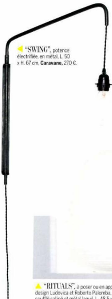
▲ "SWING", potence électrifiée, en métal, L. 50 x H. 67 cm. Caravane, 270 €.