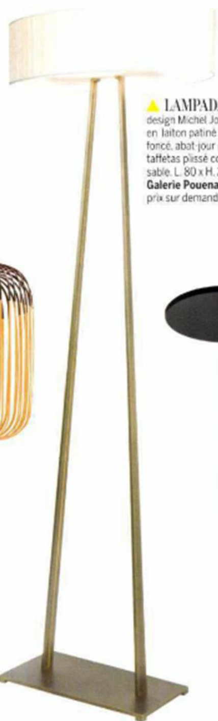
▲ LAMPADAIRE, design Michel Jouannet, en laiton patiné bronze foncé, abat-jour en taffetas plissé couleur sable, L. 80 x H. 227 cm, Galerie Pouenat , prix sur demande.