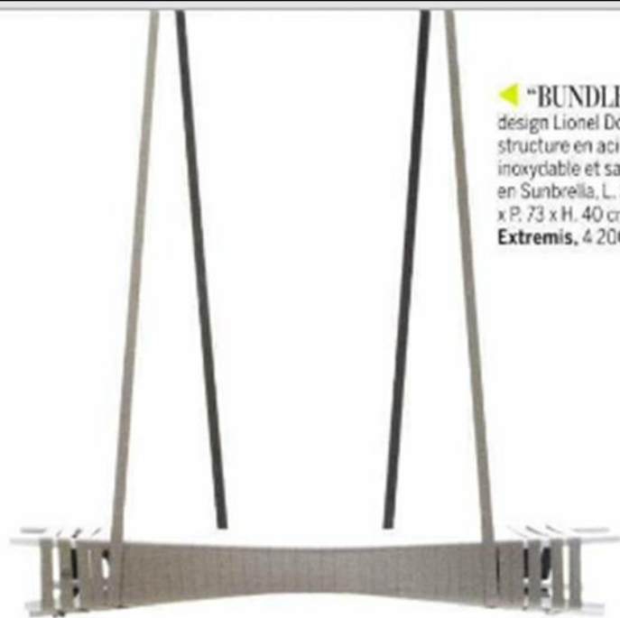
▲ "BUNDLE", design Lionel Doyen, structure en acier inoxydable et sangles en Sunbrella, L. 240 x P. 73 x H. 40 cm, Extremis , 4 200 €.