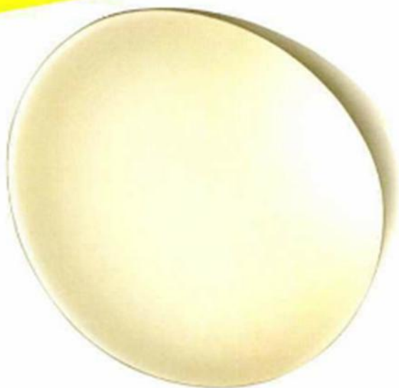
▲ "LAKE", design Lucidi et Pevere, en ABS moulé par injection. L. 48,5 x P. 9,5 x H. 48 cm. Édition Foscarini, prix sur demande.