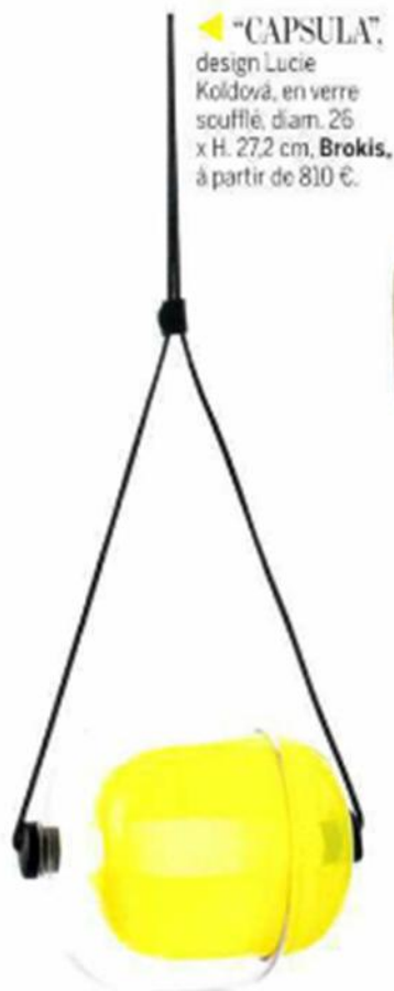
▼ "CAPSULA" , design Lucie Koldová, en verre soufflé, diam. 26 x H. 27,2 cm. Brokis , à partir de 810 €.