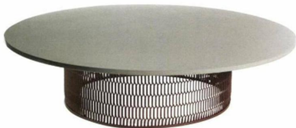
▲ "MESH", design Patricia Urquiola, en métal expansé, plateau en marbre ou en bois, diam. 135 x H. 33 cm, Kettal , à partir de 2 225 €.